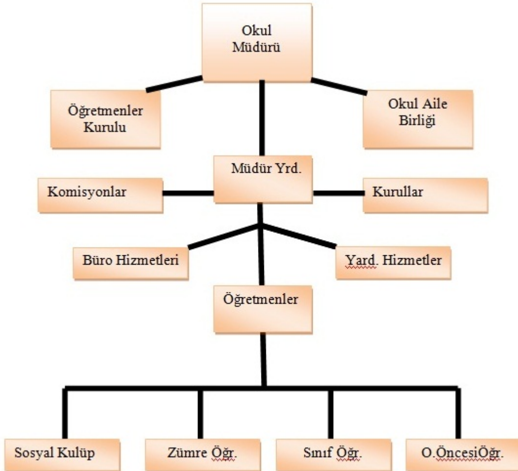
Şekil 2: Teşkilat Şeması